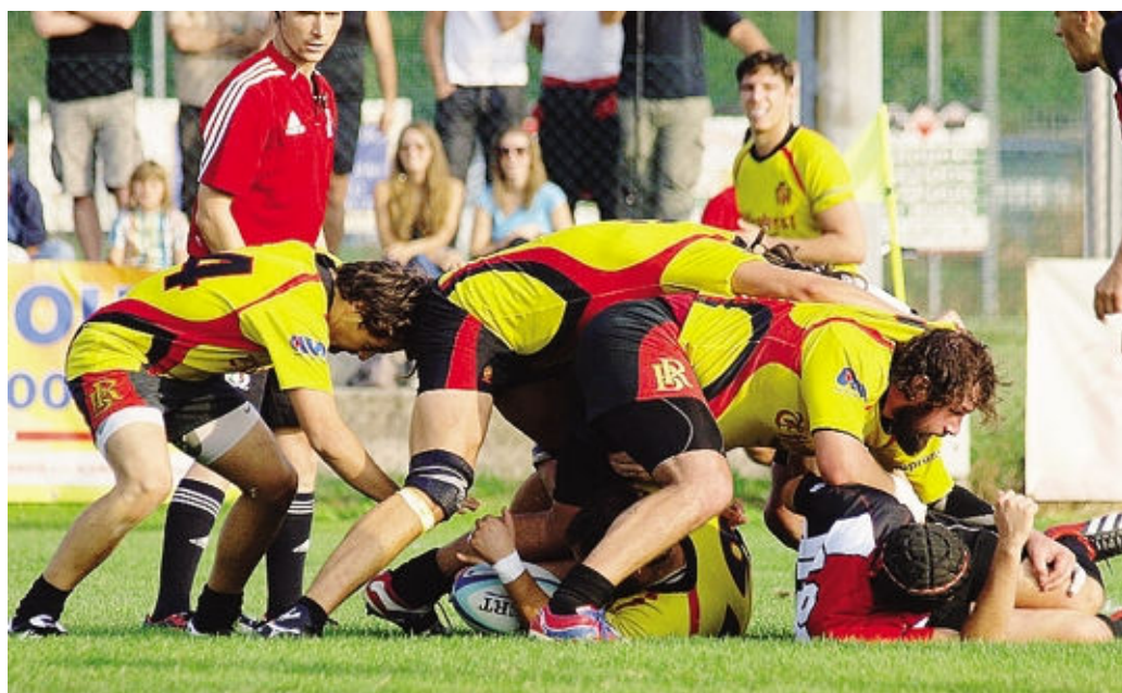
Giornata completamente negativa per la Rugby Bergamo, travolta in Piemonte da Biella

Nella ripresa la musica non cambia. Biella andrà in meta in altre cinque occasioni, approfittando pure della superiorità numerica, e certificando una vittoria mai in discussione. Il team locale,