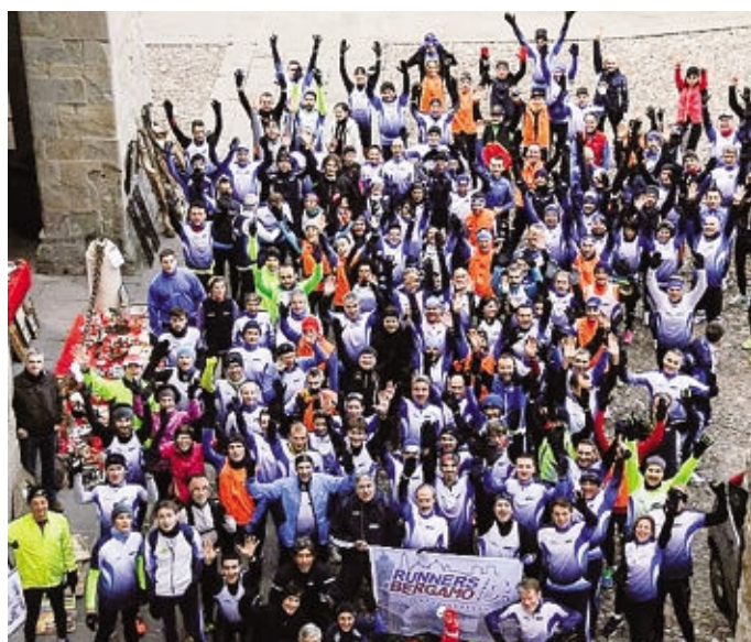
La foto di gruppo dei Runners Bergamo in piazza Vecchia