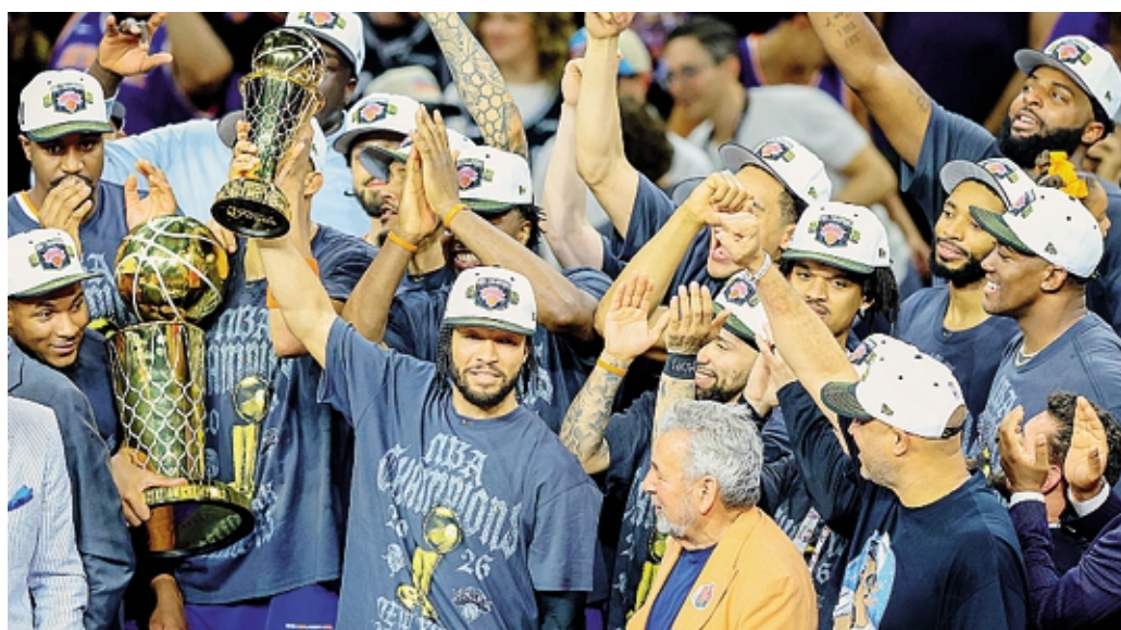
I Knicks con il trofeo dei campioni Nba e (al centro) Jalen Brunson con quello di Mvp delle Finals

Tira un sospiro di sollievo dunque Gianni Infantino, che però nella classifica delle preferenze americane e newyorkesi vede ancora, davanti alla massima competizione della Fifa di cui è presidente, il matrimonio di Taylor Swift e persino il quinto film dei Minions, in uscita il primo luglio. Tifosissima dei Knicks - come tanti altri Vip, dal regista Spike Lee agli attori Thimoée Chalamet, Ben Stiller e Jennifer Lopez - la regina delle classifiche musicali di tutto il mondo sposerà la star del football Travis Kelce il 3 luglio proprio al Madison Square Garden, la Mecca del basket, ora anche casa dei neocampioni Nba, dov'era in prima fila anche in occasione di gara 4 delle Finals. Tira un sospiro