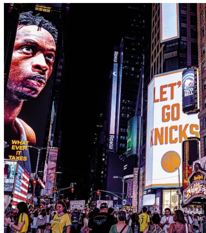
Tifosi brasiliani di calcio in Times Square in festa «griffata» Knicks

Fino a sabato notte, pur diventando una delle squadre più iconiche della lega, i Knicks avevano vinto solo due titoli, nel '67 e nel '73, con Willis Reed e Walt «Clyde» Frazier. Del '99 invece l'apparizione precedente alle Fi-