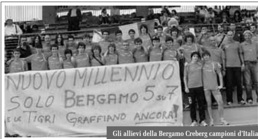
Gli allievi della Bergamo Creberg campioni d'Italia