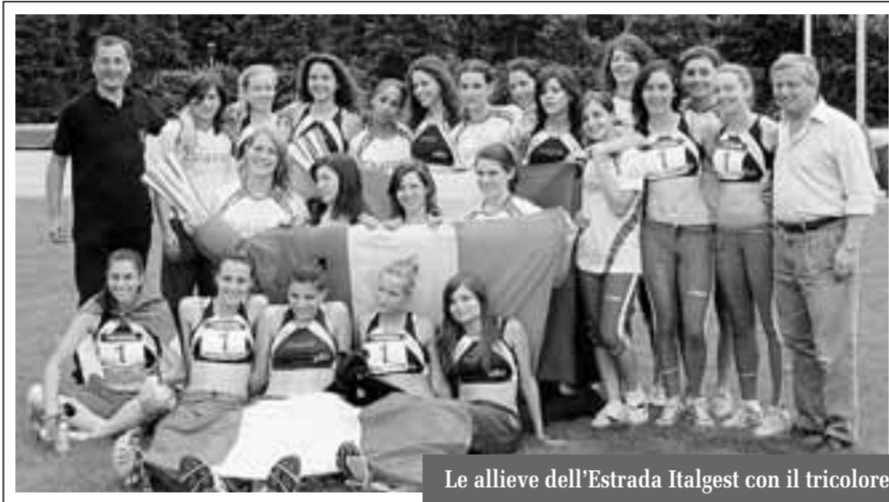
Le allieve dell'Estrada Italgest con il tricolore