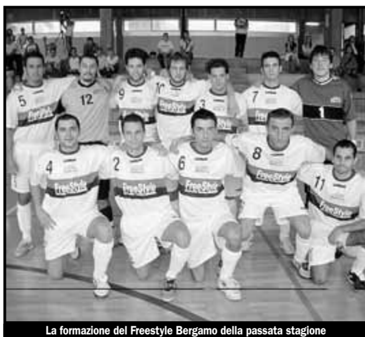
La formazione del Freestyle Bergamo della passata stagione

■ Freestyle Bergamo, una stagione per puntare in alto. Inizia domani il campionato di serie B di calcio a cinque e la squadra rossoblù si presenta ai nastri di partenza spinta da ambizioni di alta classifica. Riduci dall'ottimo quinto posto dello scorso anno, gli uomini di Zanenga partono con il dichiarato obiettivo di migliorarsi: in parole povere, il traguardo sono i playoff. Una meta alla portata del Freestyle Bergamo, che durante l'estate ha badato a mantenere intatta l'intelaiatura della passata stagione, piazzando qualche acquisto mirato per completare al meglio la rosa.