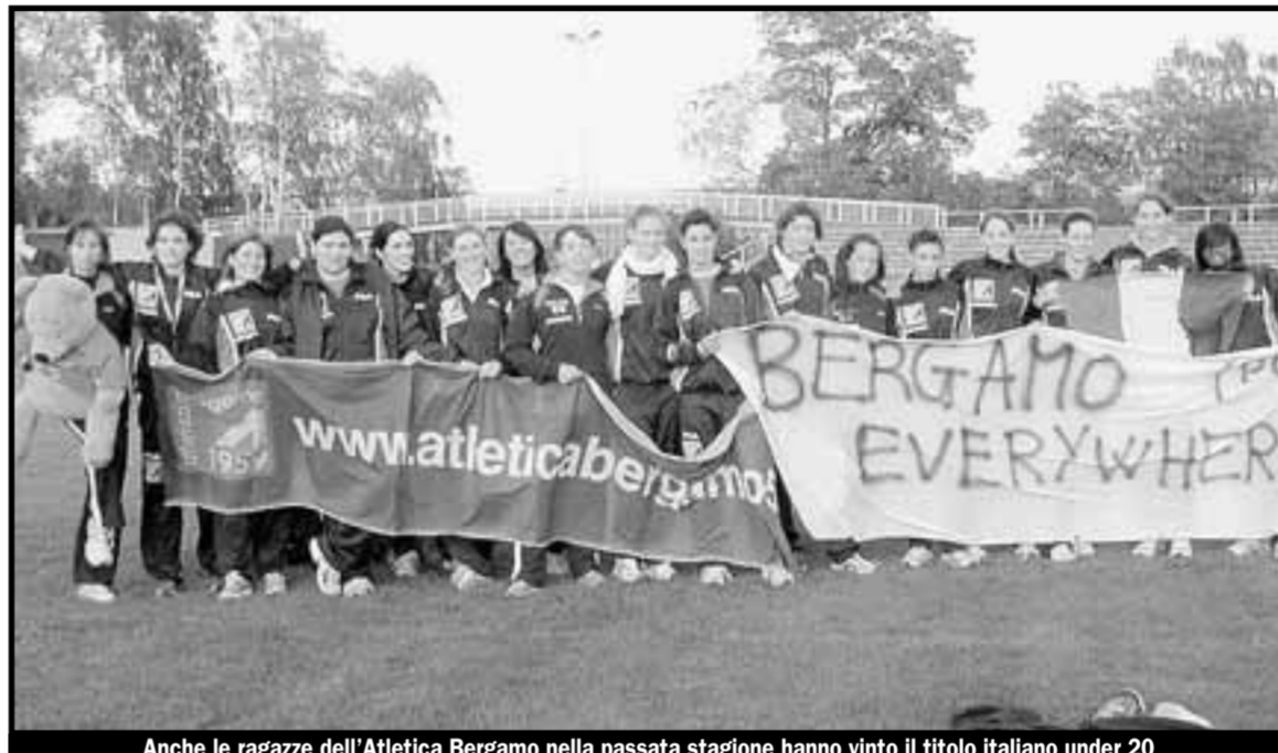
Anche le ragazze dell'Atletica Bergamo nella passata stagione hanno vinto il titolo italiano under 20

Sempre domani campionato italiano della 24 ore su pista dove Pirotta difende il titolo. E a Cremona finale regionale società cadetti