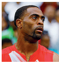
Lavoro ...mentre gli altri corrono: Tyson Gay, Steve Mullings, Asafa Powell