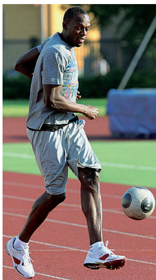
Svago Bolt gioca a calcio...

Lui tira calci a un pallone, e il resto del mondo corre. Lui inforca le cuffie alzando il volume del reggae nelle orecchie, e gli altri si spolmonano. Lui si strafoga di pollo fritto e patatine («Ma meno di un tempo...»), e i rivali si accucciano sui blocchi per staccare il biglietto per Daegu. Dura la vita di Usain Bolt, lo sprinter che, da campione uscente sui 100 (9"58) e i 200 (19"19), è già ai Mondiali (27 agosto-4 settembre), sul tartan che ne certificherà la grandezza. Poiché la Velocità non passa mai dalla porta, Bolt non parteciperà alle selezioni giamaicane, in programma nel week-end a Kingston quando già sapremo (i Trials Usa cominciano oggi a Eugene, Oregon: la finale dei 100 si corre domani alle 18.20 ora locale) quali missili