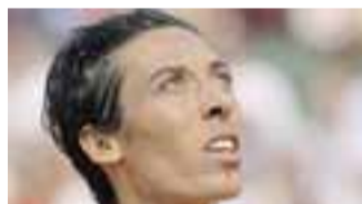
Francesca Schiavone