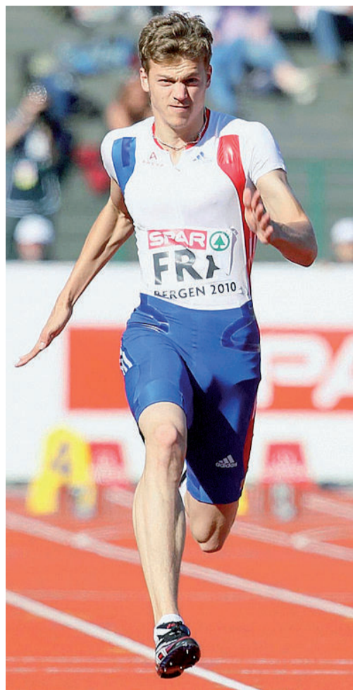
Christophe Lemaitre, 20 anni, tre ori europei