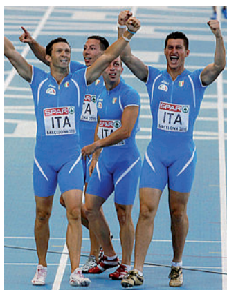
La 4x100 maschile d'argento