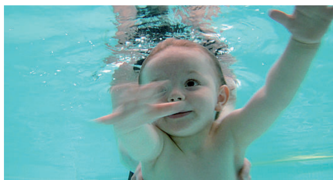
I bambini stanno in acqua con maggiore naturalezza rispetto agli adulti

I consigli dei nonni Non immergetevi dopo mangiato. Lo dicevano i nostri nonni: lo stomaco pieno non solo schiaccia in alto la cupola diaframmatica,