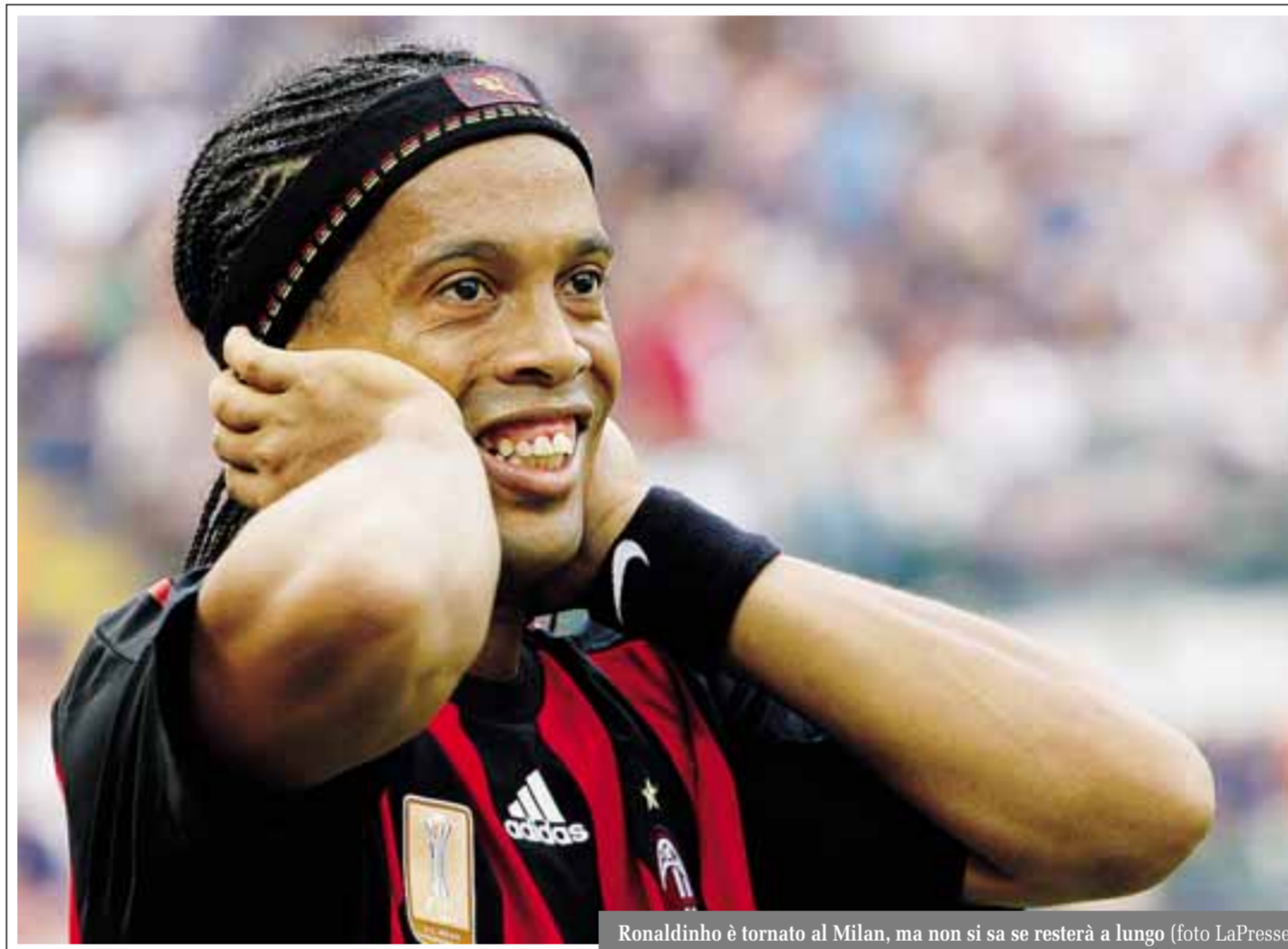
Ronaldinho è tornato al Milan, ma non si sa se resterà a lungo

L'obiettivo è rassicurare tutti, dai tifosi ai giocatori, sul futuro di una società che punterà come sempre a vincere, sempre con la stessa durezza. Ma senza i grandi colpi di mercato del passato.